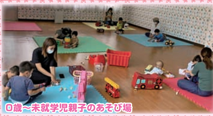
0歳～未就学児親子のあそび場