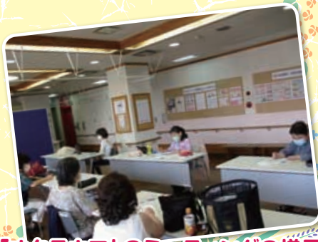
フォークダンスグループ「オクラホマ」のミーティングの様子

ボランティア・市民活動センターでは、現在ボランティアグループの皆様へ他者と密になったり大声を出すなどの活動を控えていただいています。ただ、多くの制限がある中でも「仲間の顔だけでも見て元気をもらいたい」との思いから、打ち合わせ会としてセンターを利用しているグループもあります。本来の活動が再開できるようになるまで、それぞれができる範囲で活動を行いながら、今の時期を乗り切りましょう!