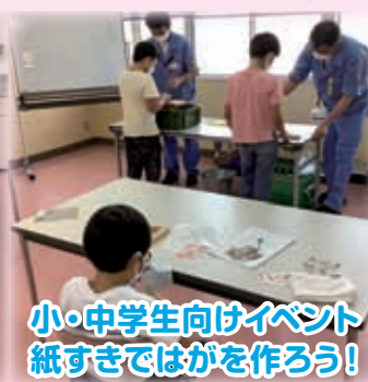
小・中学生向けイベント 紙すきではがを作ろう！