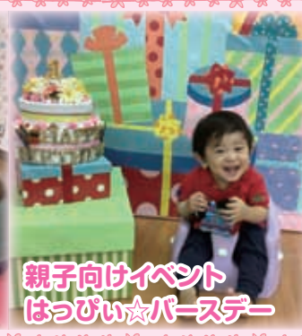
親子向けイベント はっぴい☆パースデー