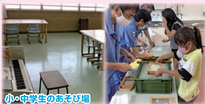
小・中学生のあそび場