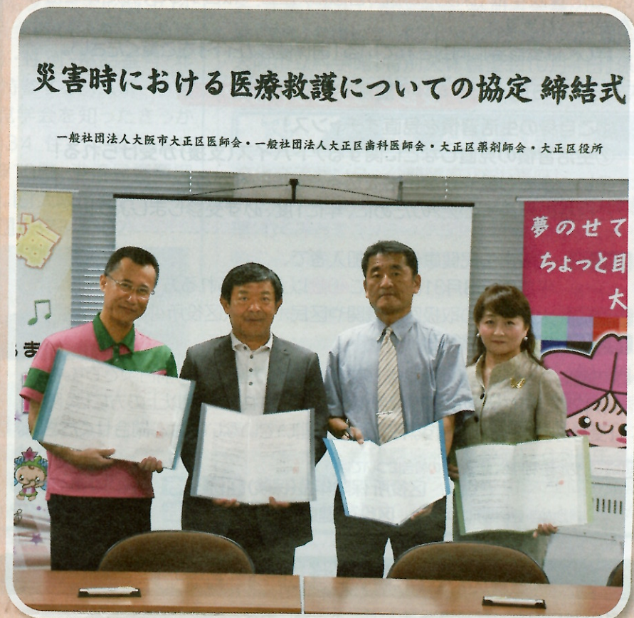
災害時における医療救護についての協定 締結式

一般社団法人大阪市大正区医師会・一般社団法人大正区歯科医師会・大正区薬剤師会・大正区役所